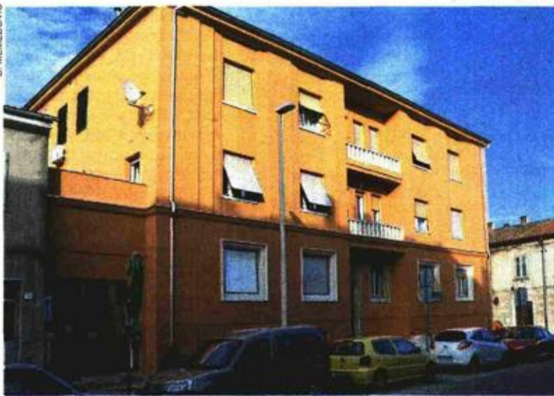
Zgrada u Vukovarskoj ulici nakon obnavljanja

PULA - Posljednjih godinu dana mnoge su pulske višestambene zgrade krenule u obnovu fasada, krovišta i stolarije. I mnogi SU iskoristili da velik dio tog projekta financiraju bespovratnim državnim sredstvima i iz europskih fondova jer Europa daje izdašna sredstava za razdoblje do 2020. godine, što za pripremu dokumentacije i građevinske radove, što za edukaciju građana i šire javnosti. Naime, Fonda za zaštitu okoliša i energetske učinkovitosti već je raspisao dva natječaja za sufinanciranje projekata obnove zgrada po cijelom Hrvatskoj, a uskoro slijedi novi, treći, natječaj.