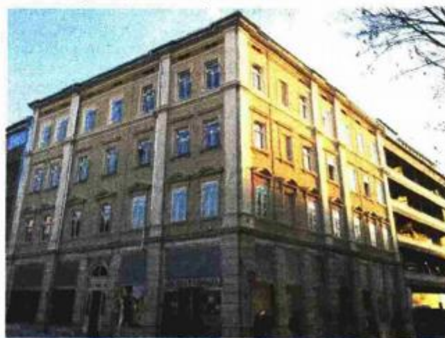
Obnovljena zgrada na Giardinima donijela je smanjenje troškova preko 60 posto