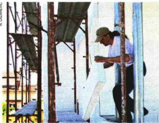
Obnovom pročelja do značajne uštede