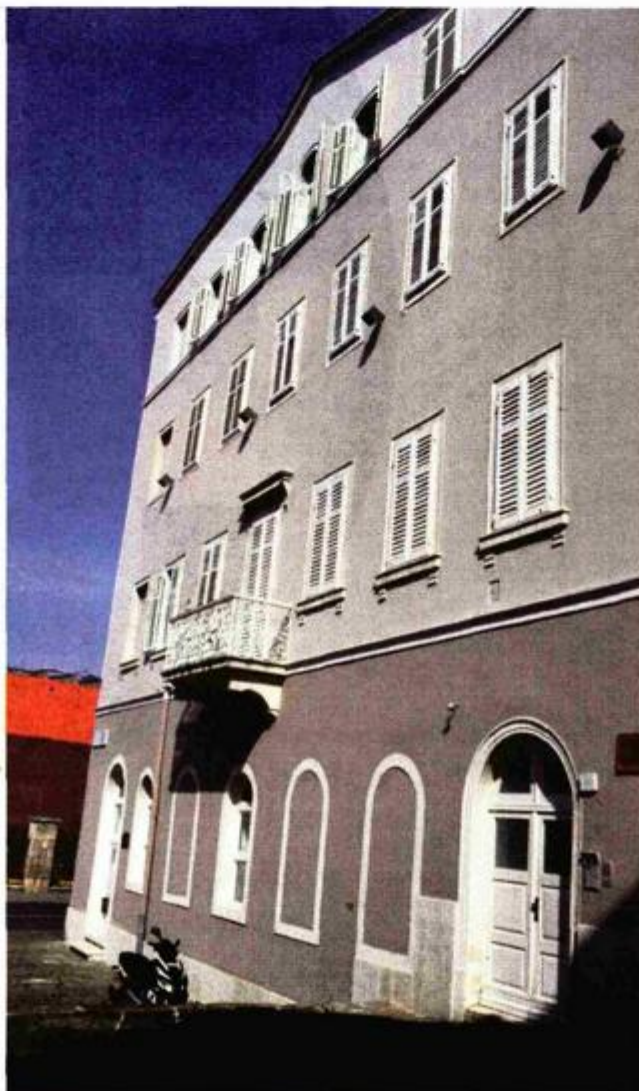
Jedno od uređenih pročelja na Kapitolinskom trgu

ovu ulicu, Danteov trg, Forum, Trg Stare tržnice, Prolaz sv. Nikole, Flaciusovu ulicu, Kandlerovu ulicu, Carrarinu i Amfiteatarsku ulicu, trg Ozad Arene, Istarsku, Scalierovu i Flavijevsku ulicu, Giardine te Flanatičku i Fontičku ulicu. Jedna od najvidljivijih lokacija je i Kapitolinski trg za koji je Grad već sada zaprimio tri prijave, čime će se u potpunosti urediti ova iznimno značajna lokacija neposredno do glavnog gradskog trga Forum i Augustovog hrama.