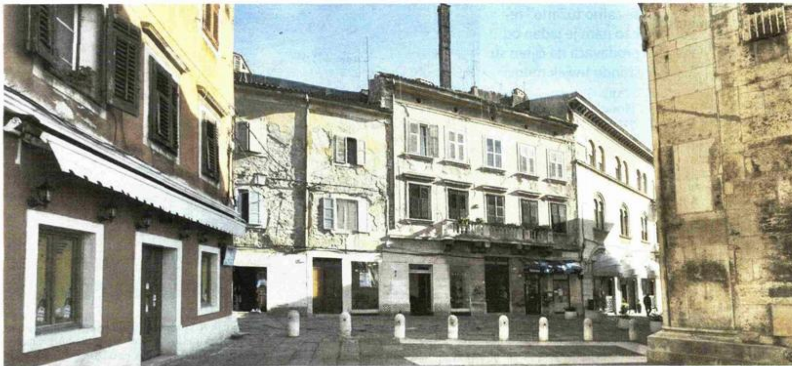
Obnova pročelja i krovista trebala bi se nastaviti na Kapitolinskom trgu

vlasničkog udjela u građevini. Raspon izdvajanja Grada Pule, putem suvlasničkog udjela, na taj način može biti od nekoliko desetaka tisuća kuna do preko 100 tisuća kuna, ovisno o vrsti radova i veličini same građevine. Vjerujemo kako ćemo i na ovaj način svim zainteresiranim sugrađanima zasigurno olakšati odluku o pokretanju obnove, zaključio je Matić.