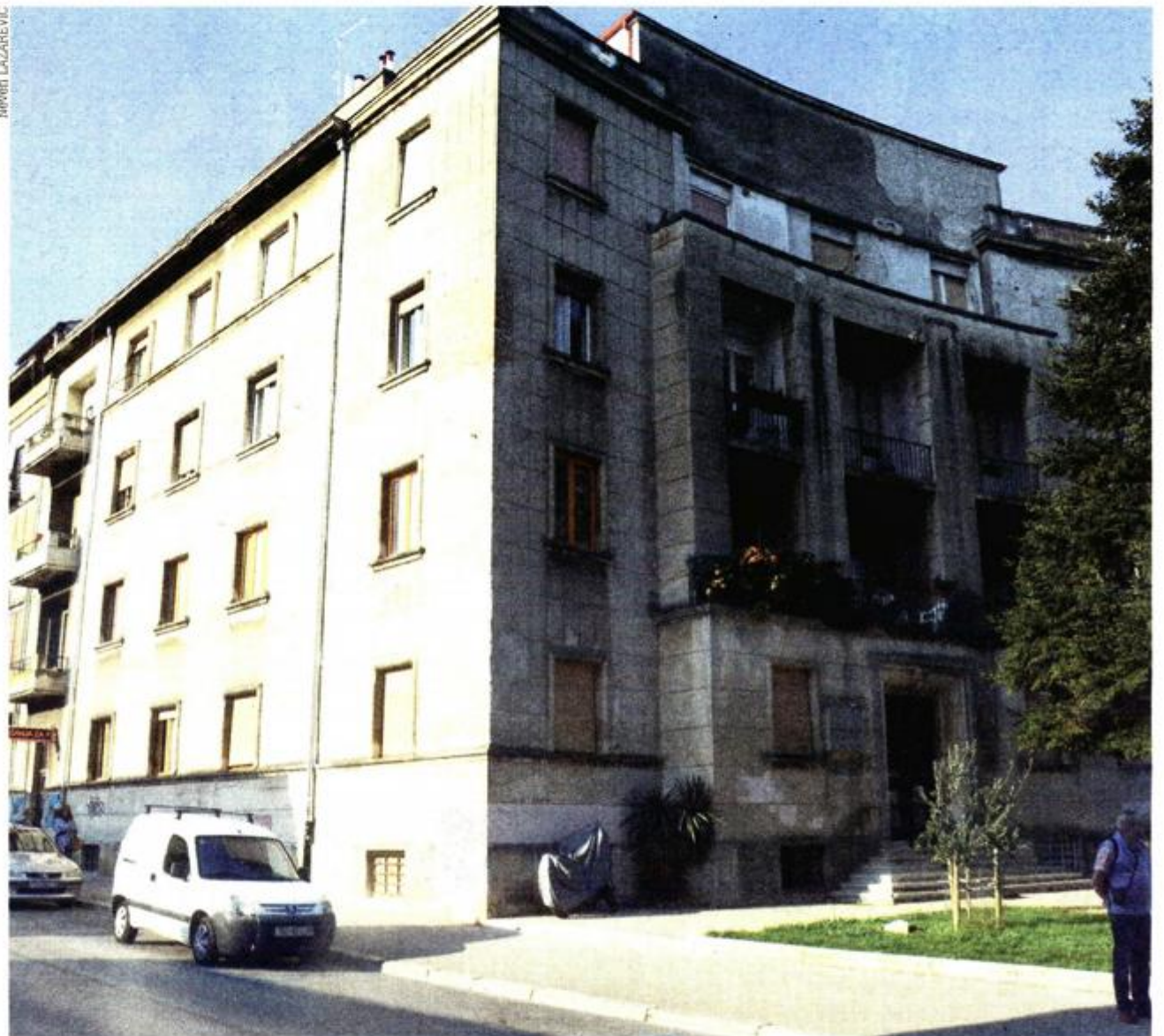
U zgradi su i danas dvije ordinacije

- Castrum Pula, kao upravitelj, kroz svoje se djelovanje zalaže za kvalitetno uređenje i energetska obnova, uz što manje troškove za suvlasnike u zgradi. Na taj način djelujemo i u projektu koji je pred nama, konkretno za blok zgrada nedaleko Arene, gdje će se više od 50 posto troškova investicija podmiriti iz javnih izvora. Riječ je o vrlo zahtjevnoj obnovi budući da je projektna dokumentacija uskladeni s konzerva-