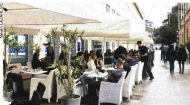
Zgrada u Flanatičkoj 12 dobila je 206 tisuća kuna