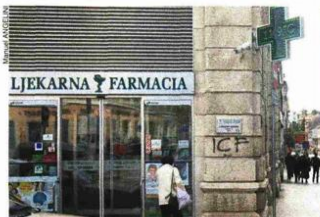
Na jesen kreće uređenje zgrade u kojoj je smještena ljekarna

- Činjenica je da kod ovakvih projekata, odnosno podizanja kredita, rata pričuve