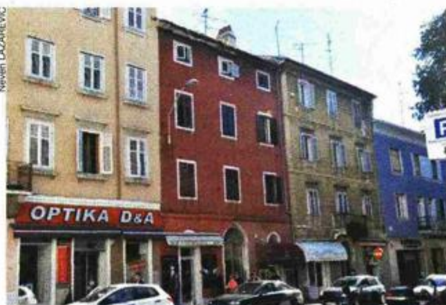
Uređenje Giardina 8 uljepšat će starogradsku jezgru