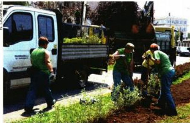
Sadnja mediteranskog bilja u Parku mladenaca

na glavnog gradskom trgu kojemu gravitira veliki broj naših sugrađana i posjetitelja.