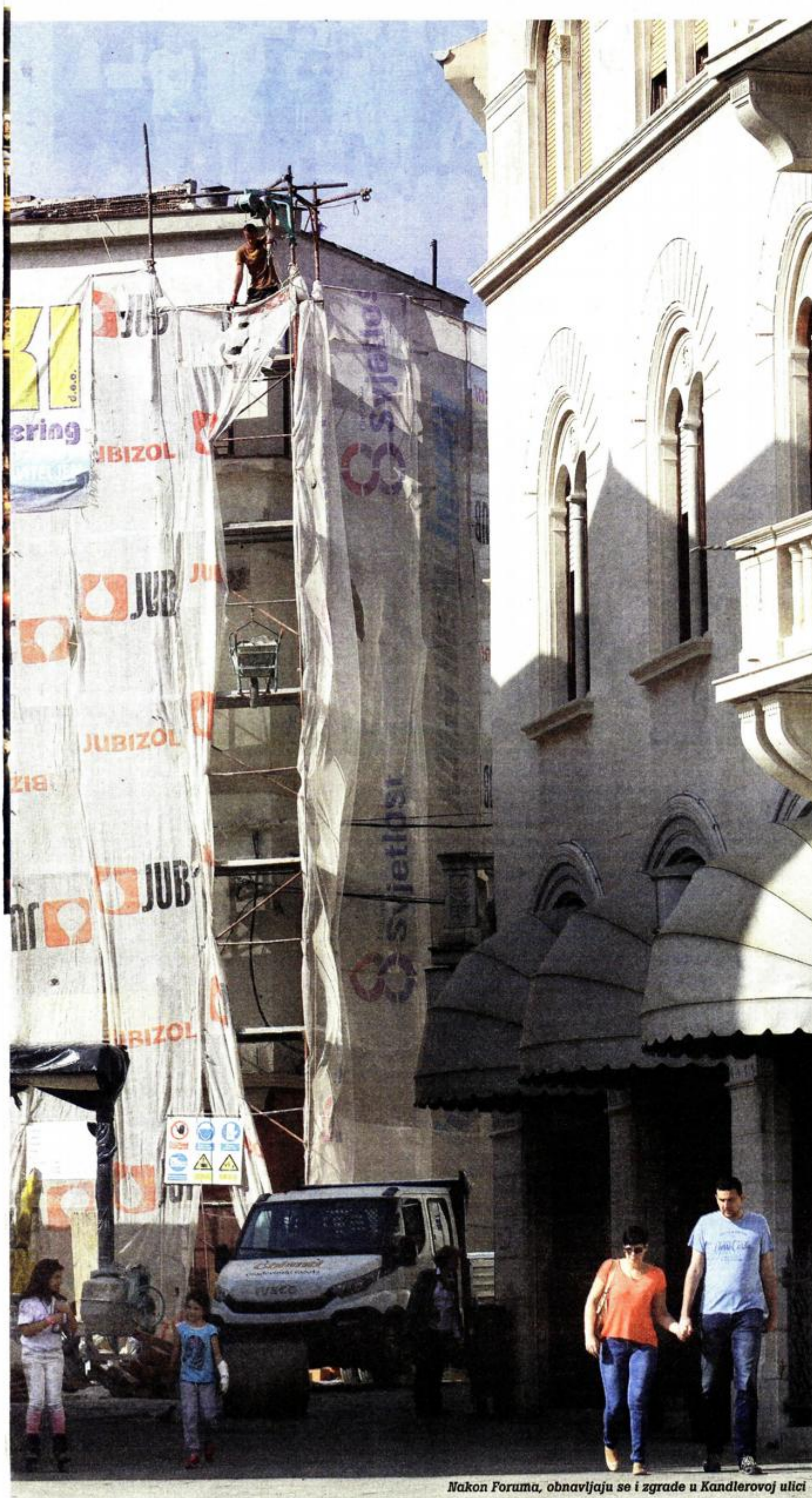
Nakon Forumu, obnavljaju se i zgrade u Kandlerovoj ulici